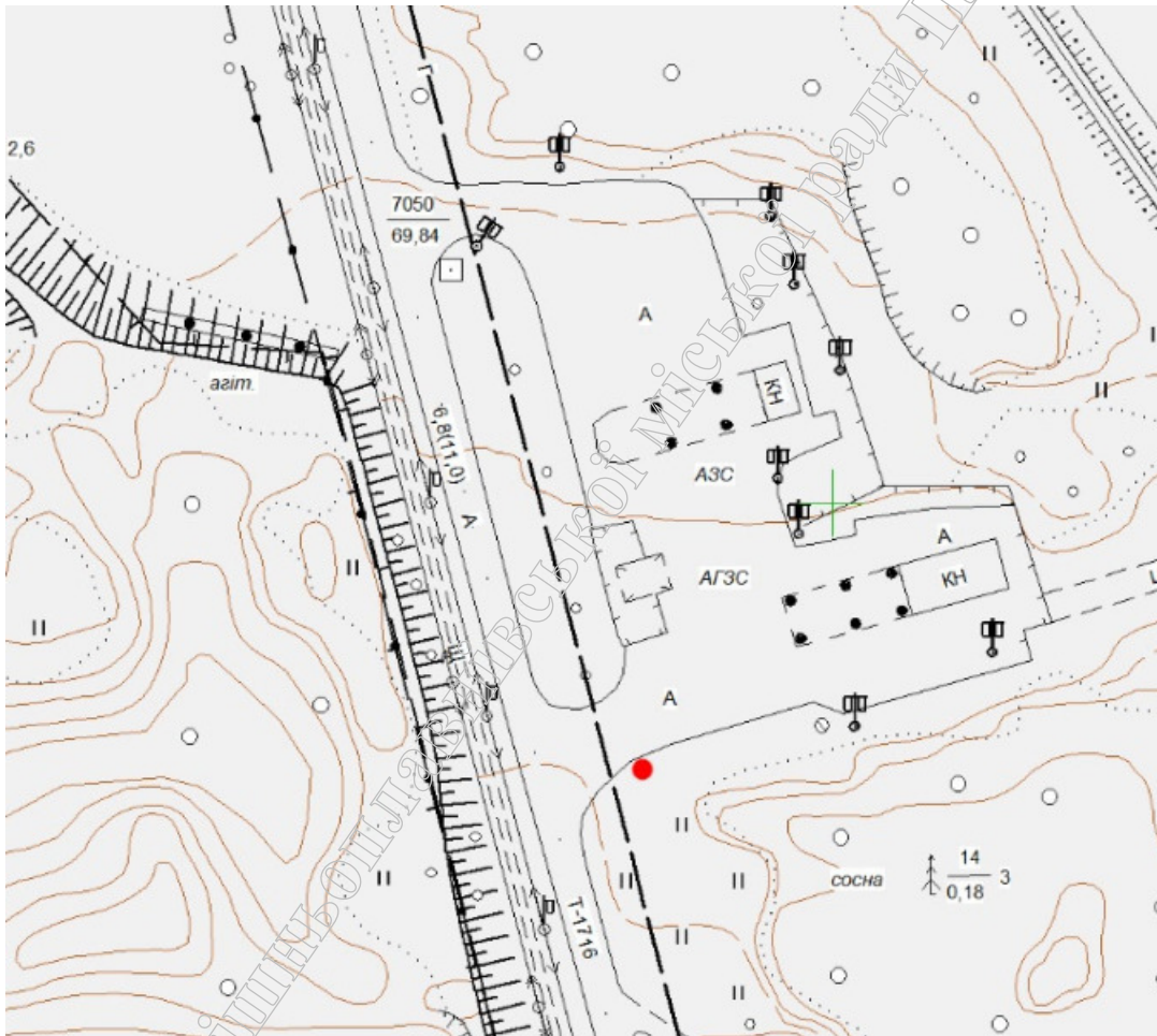
Схема розташування рекламного засобу на вулиці Дніпровській (район АЗС)

Начальник Управління архітектури і містобудування Горішньоплавнівської міської ради Полтавської області