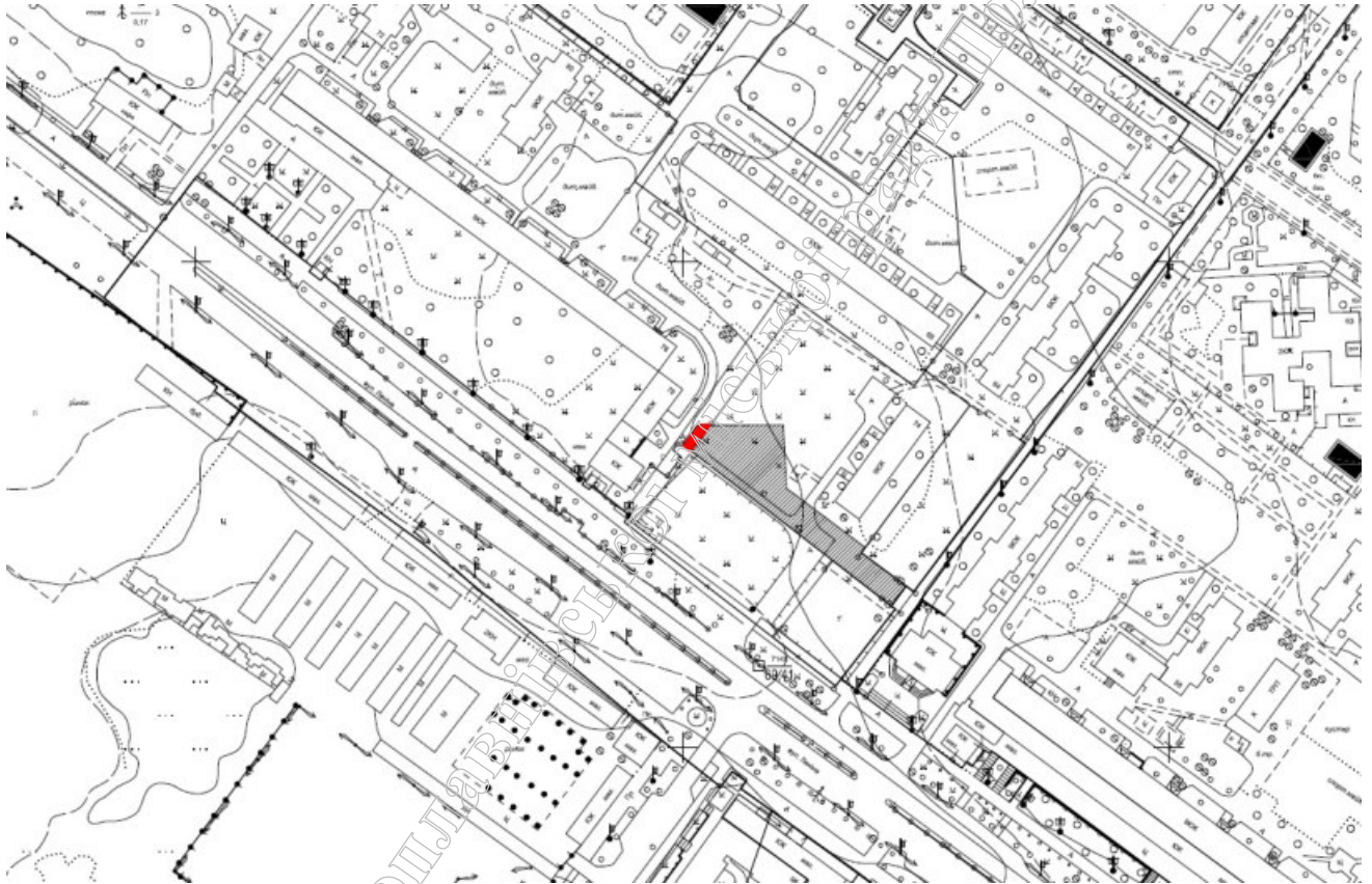
Схема земельної ділянки (кадастровий номер 5310200000:50:027:0611) із зазначенням території необхідної для будівництва автоматичної системи поливу

Начальник Управління архітектури і містобудування Горішньоплавнівської міської ради Полтавської області