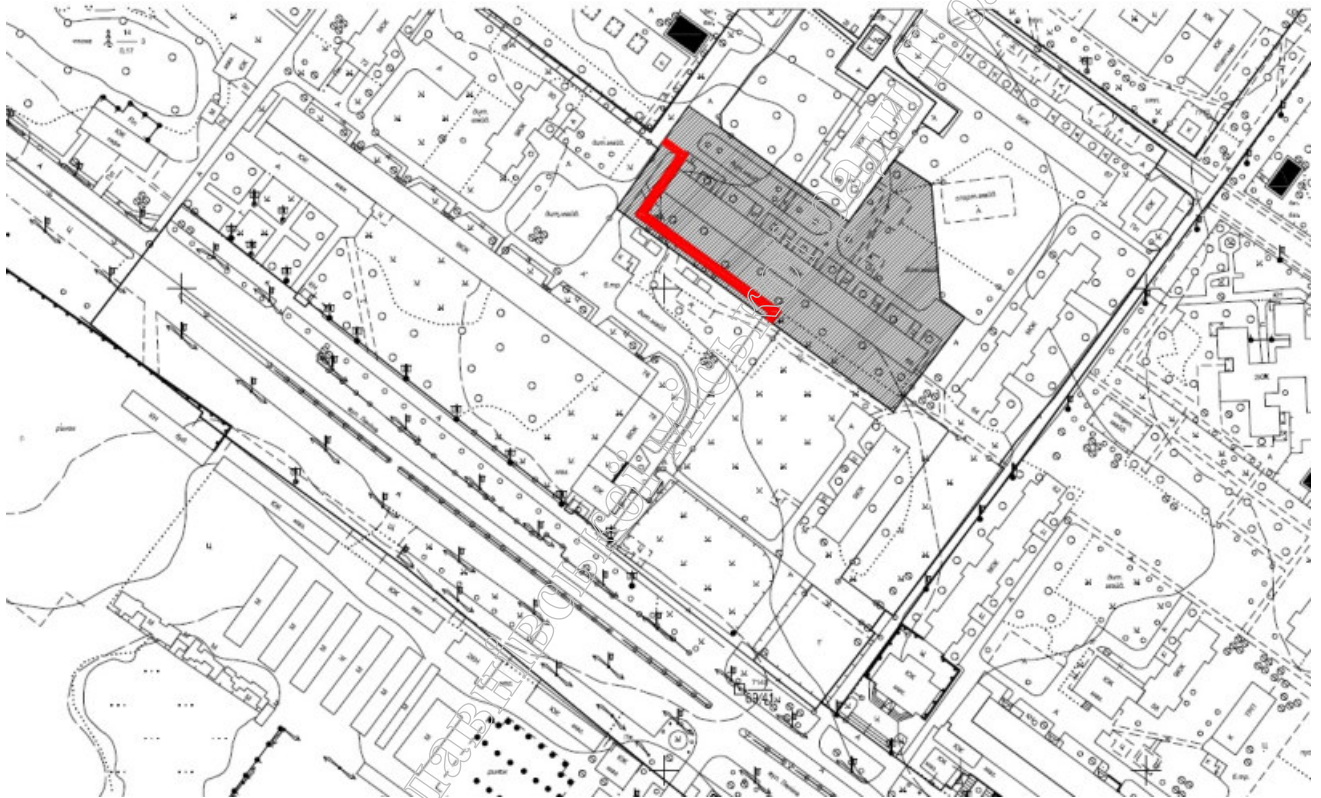
Схема земельної ділянки (кадастровий номер 5310200000:50:027:0595) із зазначенням території необхідної для будівництва автоматичної системи поливу

Начальник Управління архітектури і містобудування Горішньоплавнівської міської ради Полтавської області