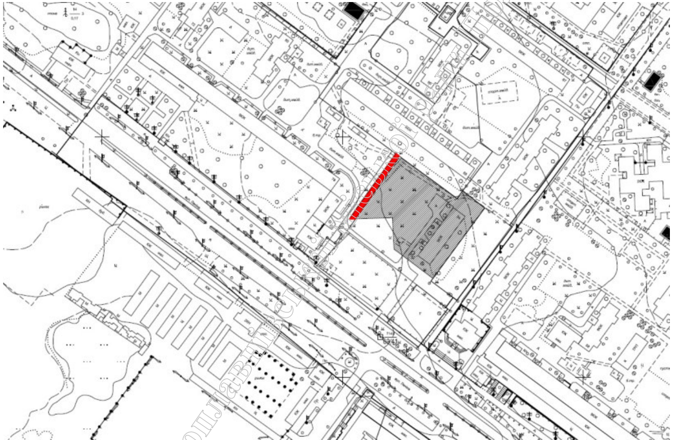
Схема земельної ділянки (кадастровий номер 5310200000:50:027:0587) із зазначенням території необхідної для будівництва автоматичної системи поливу

Начальник Управління архітектури і містобудування Горішньоплавнівської міської ради Полтавської області