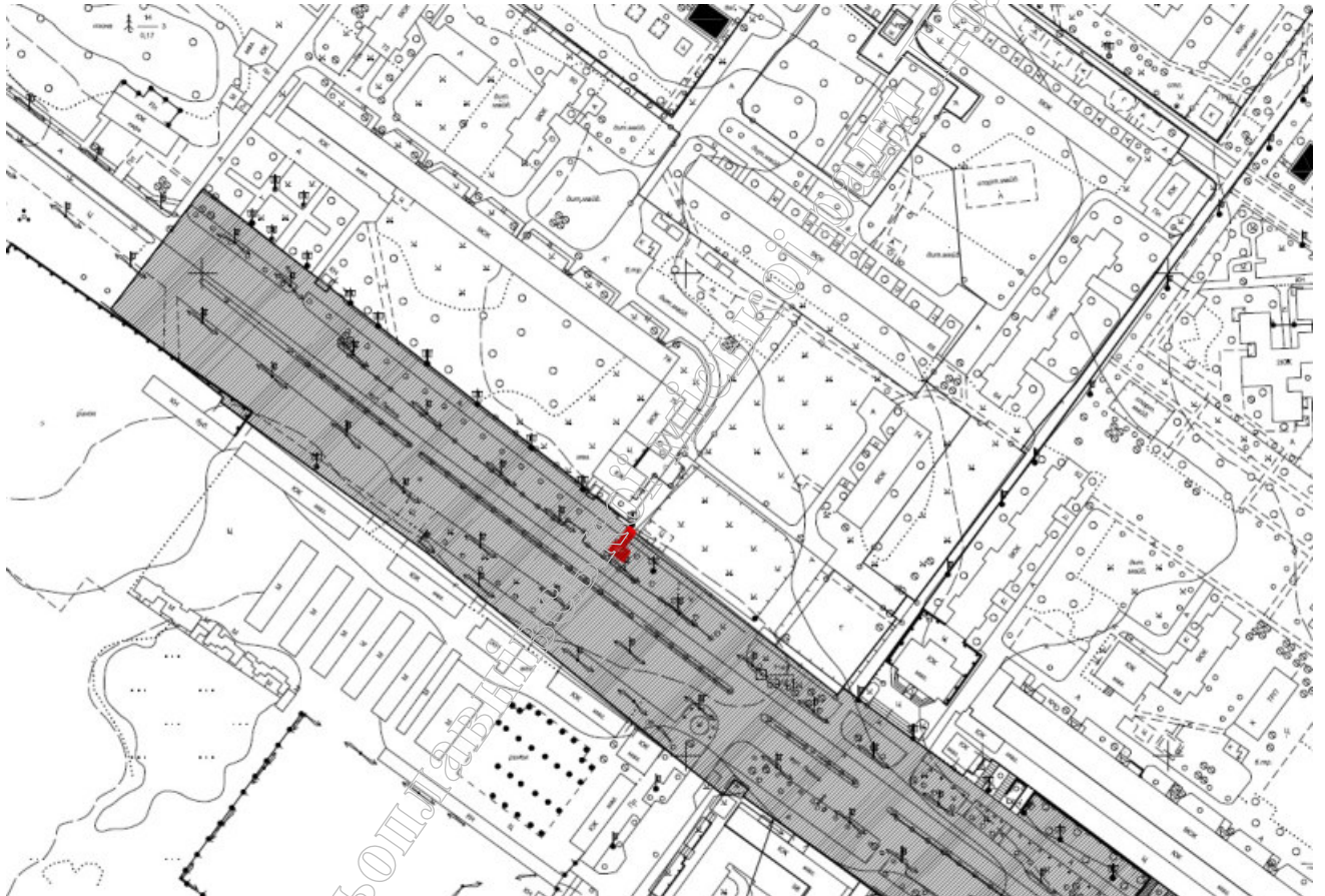
Схема земельної ділянки (кадастровий номер 5310200000:50:027:0575) із зазначенням території необхідної для будівництва автоматичної системи поливу

Начальник Управління архітектури і містобудування Горішньоплавнівської міської ради Полтавської області