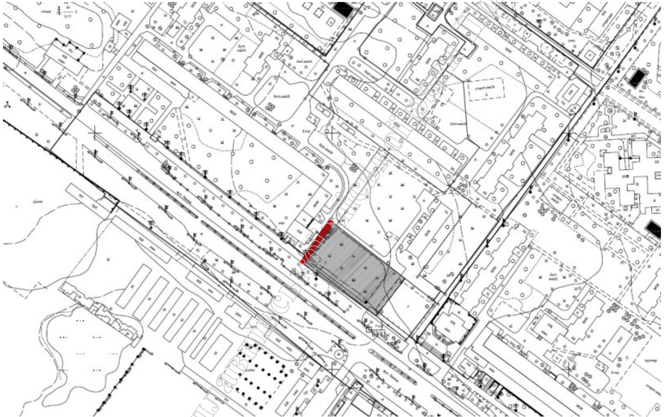
Схема земельної ділянки (кадастровий номер 5310200000:50:027:0256) із зазначенням території необхідної для будівництва автоматичної системи поливу

Начальник Управління архітектури і містобудування Горішньоплавнівської міської ради Полтавської області