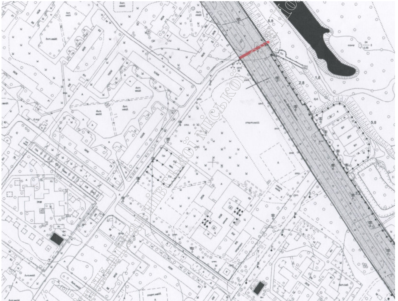
Схема земельної ділянки (кадастровий номер 5310200000:50:027:0579) із зазначенням території необхідної для будівництва автоматичної системи поливу

Начальник Управління архітектури і містобудування Горішньоплавнівської міської ради Полтавської області